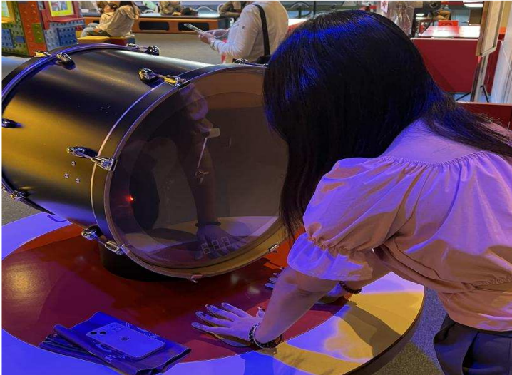
(Hong Kong Science Museum )

direct speaking country, but in fact, it was not, especially Israel.