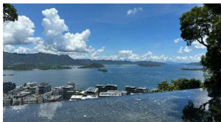
参访交流：香港中文大学