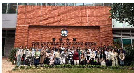
参访交流：香港大学